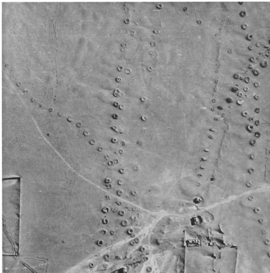
شکل ۳: تصویر هوایی قنات‌های (۱:۳۰۰۰) حاشیه‌ی جنوبی شهر کرمان در ایران با تمام جزئیاتش. دقت کنید که چگونه مسیر این قنات‌ها از مناطق متروکه در قسمت مرکزی تصویر به طرف پایین عبور می‌کند.