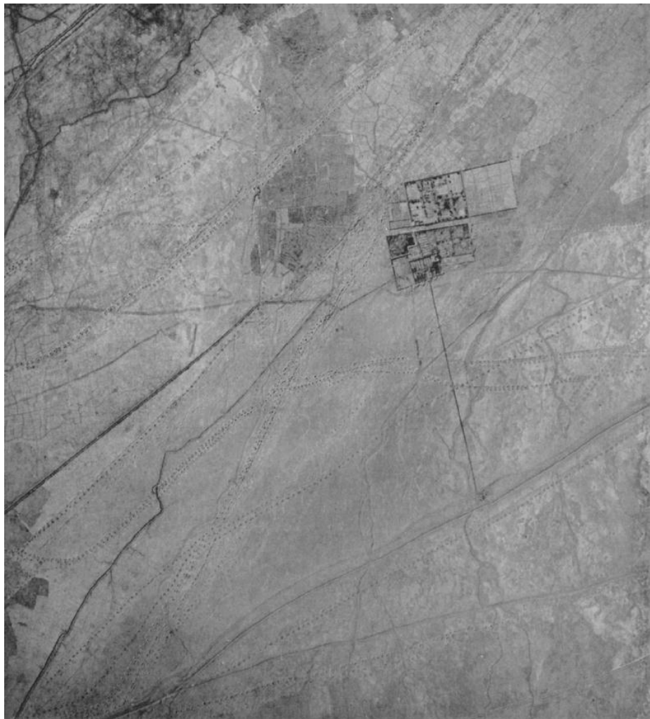
شکل ۲: تصویر هوایی (۱:۱۸۷۵) نمایانگر اثر (حلقه چاه های) قنات های واقع در جنوب شهر کرمان در ایران. به قناتی که در قسمت بالایی سمت راست تصویر وارد باغ می شود، دقت کنید.